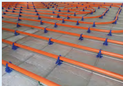
Voorbeeld van vloerverwarming

Het is mogelijk om de Insulit Bi+9 te gebruiken in combinatie met vloerverwarming. In dat geval raden wij aan om deze op de Insulit Bi+9 te plaatsen. Er wordt een vloerverwarmingstype voorzien om zwevend te plaatsen (ijzeren net, gestructureerd membraan,...). De buizen mogen in geen enkel geval vastgehecht worden doorheen de Insulit Bi+9, hetgeen tot een akoestische brug zou leiden.