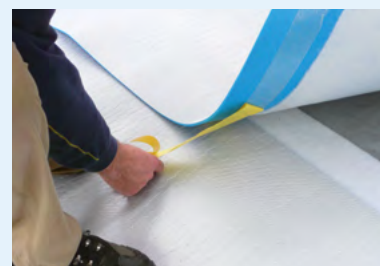
De beschermstrip van de zelfklevende band verwijderen