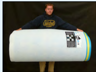
Snel en gemakkelijk te plaatsen

De Insulit Bi+9 bedekken met een verstevigde chape van minimum 8 cm dik. Eens de chape is gegoten en de vloerbedekking is geplaatst, wordt het overschot aan Insulit Bi+9 afgesneden. De plint wordt iets hoger dan de uiteindelijke vloerbekleding geplaatst om zo elke zijdelingse akoestische overdracht te vermijden. Vervolgens zal er een soepele voeg onder de plint verwezenlijkt worden.