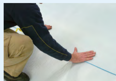
Een goede aandichting van de overlapping verzekeren