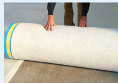
Een overlapping uitvoeren op de aangrenzende band